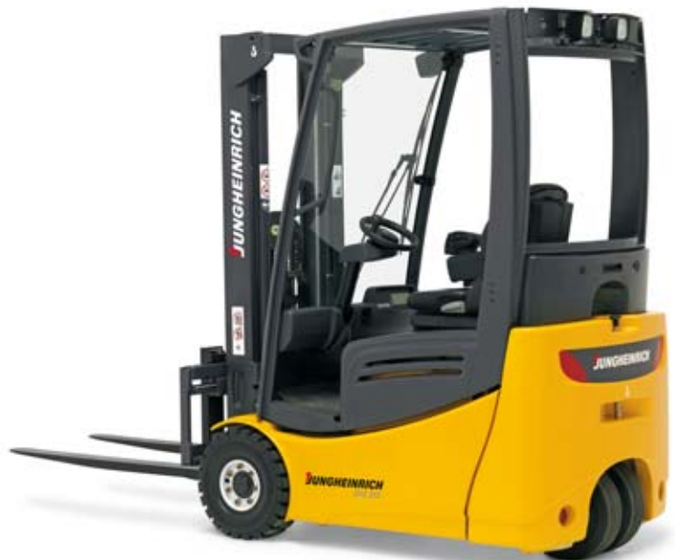
Abbildung mit Zusatzausstattungen

5 individuell einstellbare Arbeitsprogramme